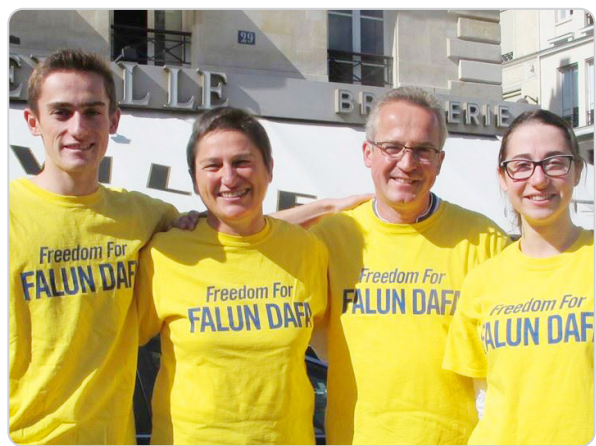
校方把法轮功的理念作为教学的一部分，使学生心灵健康，品德高尚。家长高兴地对劳伦斯女士说：“‘真善忍’的普世价值，也是我们全家人遵守的原则，我们没做到的时候，孩子会提醒我们！”