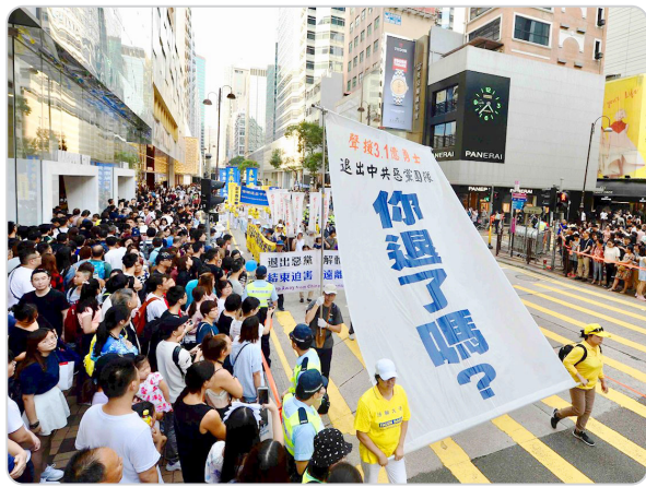
◎盛大游行中“你退了吗？”的巨幅标语，不仅震撼香港中外游客，也成为华人中的流行语。

疫情过后，城市解封，全家族人聚会。亲友们感叹地说：“疫情如此严重，我们家族中却没有一个‘小阳人’。看来，‘三退’真的能保平安啊！”