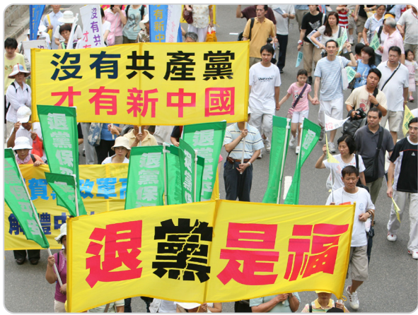
◎退党是福！庆祝“三退”的游行队伍经过香港繁华街道时，吸引许多市民与中外游客观看。