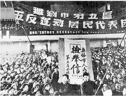
삼반오반 (1951~1952년) 비정상사망 또는 불구로 된 숫자 133,760 명(남방도시 신문)