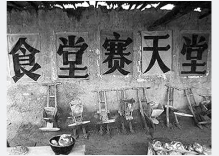
대기근 (1959~1961년) 비정상적으로 4300만~4600만 명 사망(전 중공중앙 총서기 자오쯔양 기술)