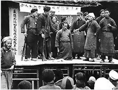
토지개혁운동 (1950~1952년) 100~200만 명이 비정상적으로 사망.(강차오 중화인민공화국사)