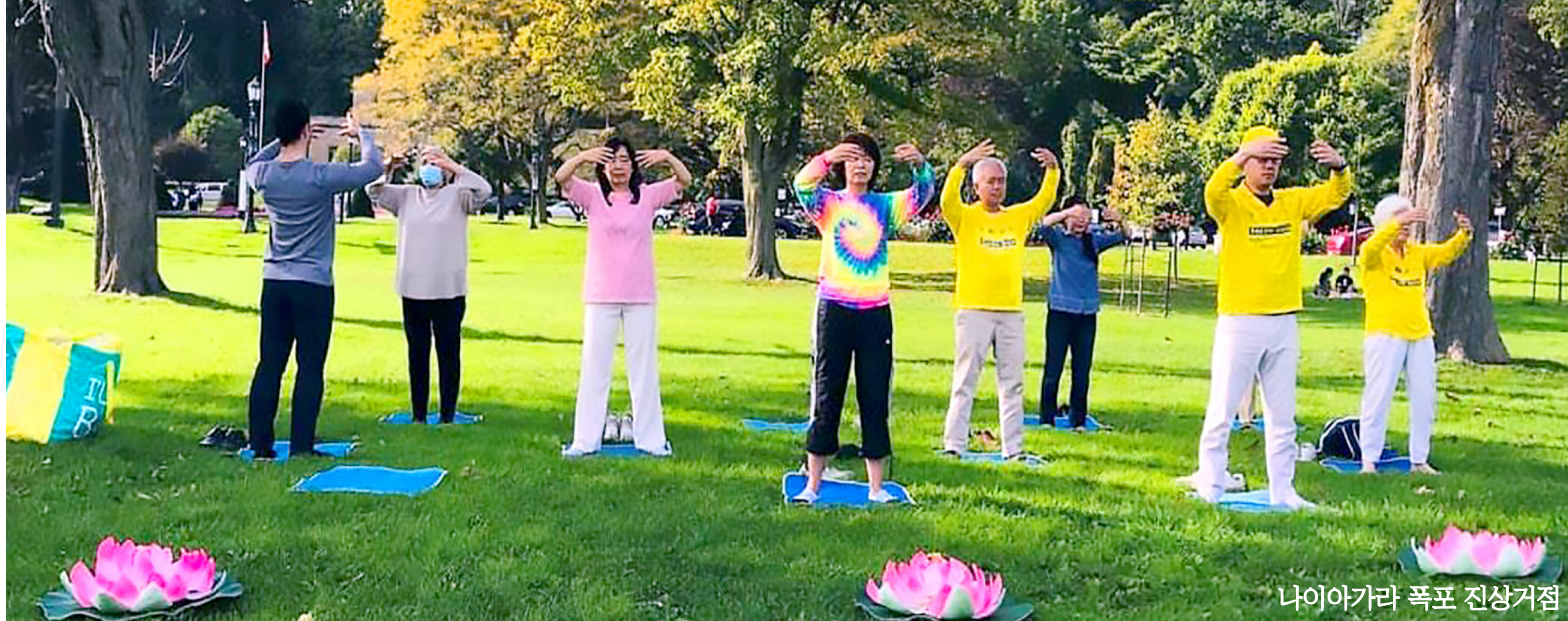
나이아가라 폭포 진상거점

“그런데 우리 중국인은 당에 맹세하는데 당은 신도 아니고 신을 반대하며, 하늘땅과 싸운다는 구호를 외칩니다. 그래서 신은 그것을 멸하려 합니다. 중국인은 6~7세부터 학교를 다니기 시작하는데 아직 세상을 모를 때 생명을 중공에게 바치게 합니다. 공산당은 당은 어머니라고 하는데, 1989년 ‘6.4’학생운동 때 만약 그