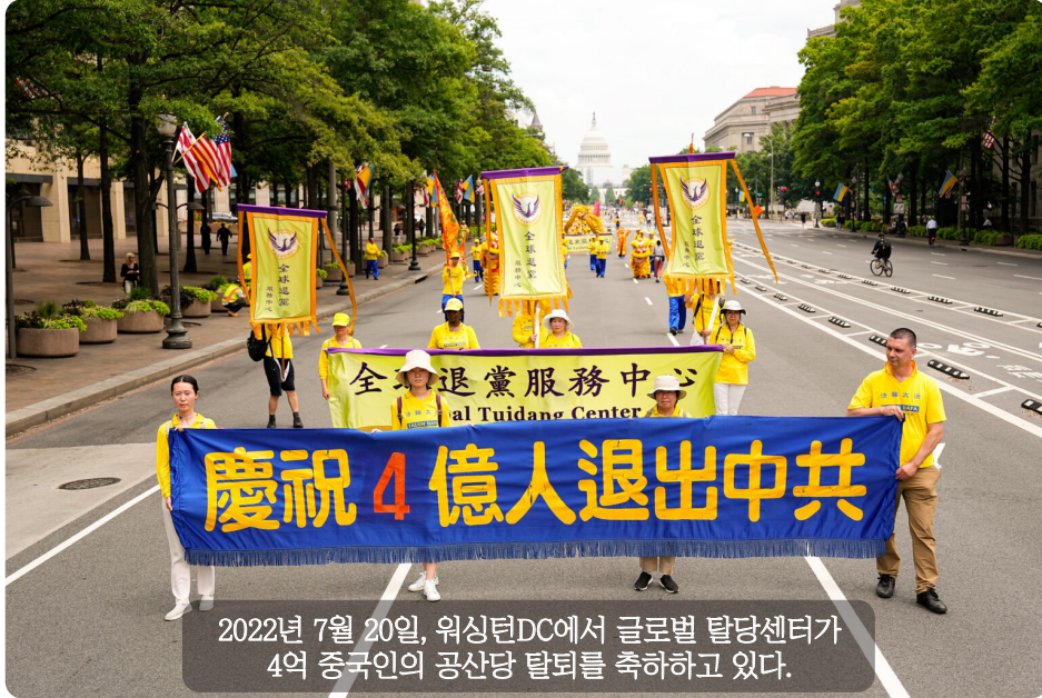
2022년 7월 20일, 워싱턴DC에서 글로벌 탈당센터가 4억 중국인의 공산당 탈퇴를 축하하고 있다.