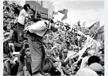
문화대혁명 (1966~1976년) 비정상적으로 733만 명 사망[중국 현지(县志) 기재 통계]; 비정상사망 2천만 명.[예젠잉(叶剑英) 기술]