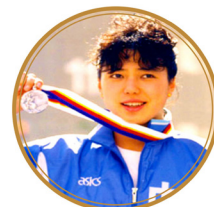
황샤오민: 올림픽 명장, 전 국가 대표 선수

기원 사이트에 공개 탈당성명을 하며 말했다. “중공 관료 집단은 기득 이익을 보호하기 위해 국가민족 대의를 돌보지 않고 민중의 지혜를 무시했으며 인권을 짓밟았다. 소위 중국특색으로 보편적인 가치에 대항했다. 부패가 횡행하고 재앙이 빈번하며 국운이 날로 쇠락하고 민생이 어렵게 되었다. 중공은 집정당으로 그 책임을 면하기 어렵다! 독재를 제거하지 않으면 재난이 그치지 않을 것이며 중공이 망하지 않으면 하늘이 용납하지 않는다!”