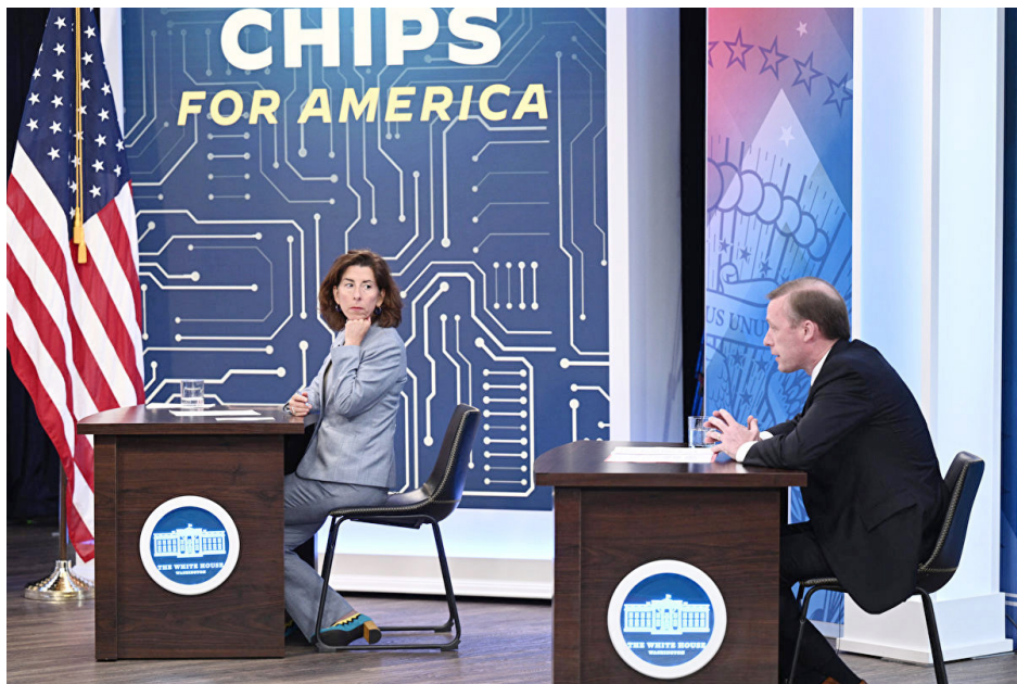
2022 年 9 月 6 日，美国商务部长雷蒙多宣布，获政府芯片资金支持的高科技企业 10 年内不得在中国建立先进的技术设施。图为雷蒙多（左）参加芯片会议时听取美国国安顾问发言。