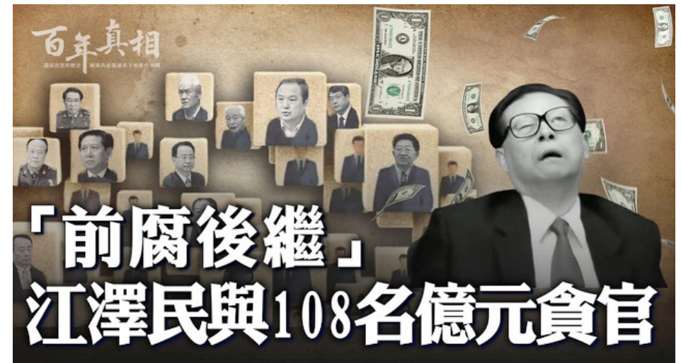
《百年真相》节目讲述江泽民及受其扶持的 108 名亿元贪官