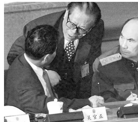
江泽民与吴官正谈话

由于国内各地对迫害法轮功不积极，江泽民十分恼火，于是与政绩挂钩，实行一把手负责制。“如果上访的法轮功（学员）超过一定数量，各地一把手撤职。现在上访人员中山东来的最多，那就告诉山东省委书记吴官正，如果再有上访人