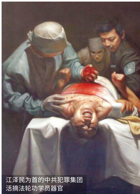
江泽民为首的中共犯罪集团 活摘法轮功学员器官