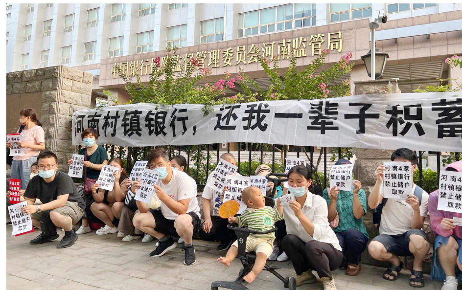
2022年4月18日和19日，河南、安徽的六家村镇银行爆雷，40万储户无法提款，涉及金额400亿元。储户维权却被赋“红码”限制出行，引发民众抗议。

江泽民死了，人们称他是人权恶棍、刽子手、千古罪人、没干过一件好事、十恶不赦。他是中共之恶的集大成者，几乎当今中国社会的所有问题，都可以追溯到江泽民。江泽民打压真善忍，实际上是祸害了全中国。 ◇