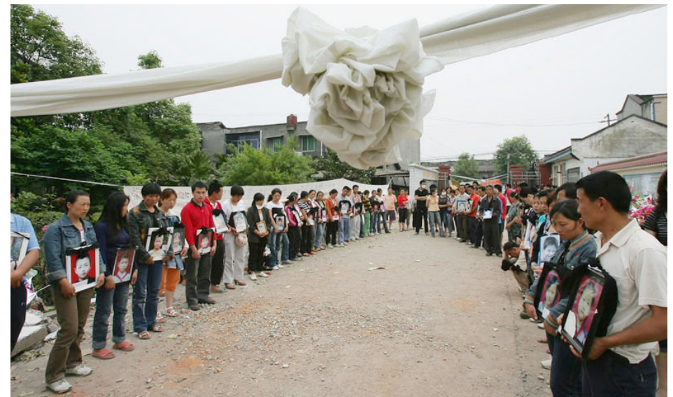
汶川地震死难学童家长投诉无门，他们呼吁严惩豆腐渣工程责任人，“天灾不可违，人祸最可恨，给冤死的孩子一个公道”。

2010年2月9日，参与调查汶川地震校舍豆腐渣工程的四川作家谭作人，被判刑5年。