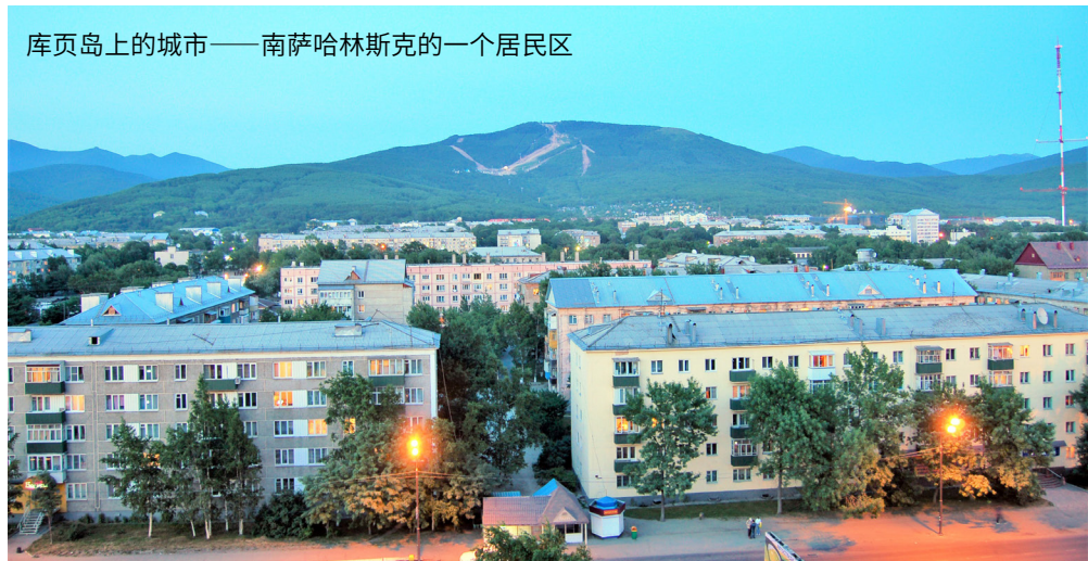
库页岛上的城市——南萨哈林斯克的一个居民区

然而，江泽民越描越黑。他 13 岁时，叔叔江上青已不在人世。照中国人习俗，江泽民怎么会被过继给一个死人呢？再说，13 岁时，江泽民和他父亲的日子，与江上青比起来，一个天上一个地下，也没有过