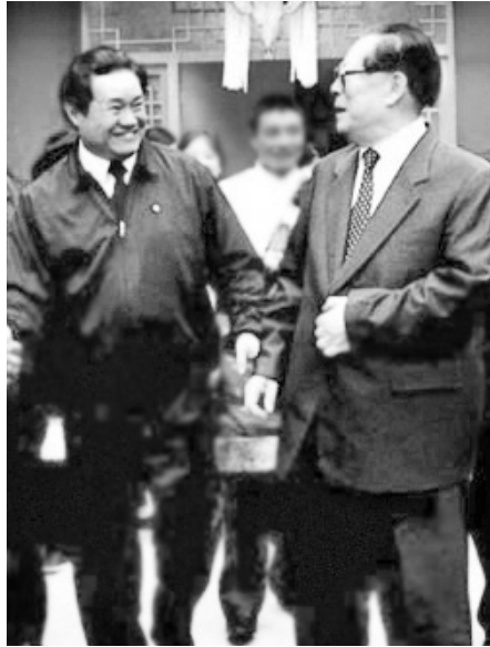
周永康（左）当年积极追随江泽民迫害法轮功，成为中共政法委书记，现因贪腐被判无期徒刑入狱。

江泽民曾到四川视察，听汇报时，对迫害死43名法轮功学员的四川省委书记周永康大加赞赏。周遂被重用，成为中