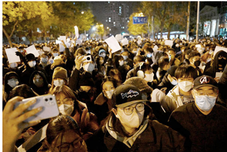
2022年11月27日，北京街头，人们手举白纸，抗议中共草菅人命的极端防疫政策。