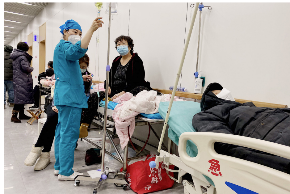
中共三年“疫情清零”资源耗尽，彻底失败后撒手不管，染疫人数激增，药品短缺，医院爆满。图为2022年12月28日，天津市南开医院的COVID-19患者在走廊输液。

意大利是该病毒在中国出现后于2020年2月遭受重创的第一个欧洲国家。此次从2022年12月26日开始，意大利米兰的主要机场马尔彭萨机场，开始对来自北京和上海的旅客进行检测，结果显示近50%的中国旅客已感染。