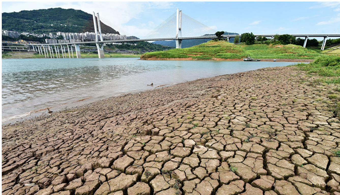
江泽民时期，中国的环境迅速恶化，环保专家惊呼“国在山河破”。图为长江重庆段的干枯河床。