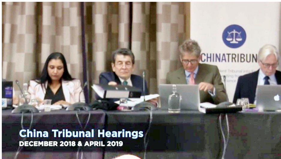
2019年，英国御用大律师杰弗里·尼斯爵士（左二，曾在前南斯拉夫国际审判中起诉米洛舍维奇）主导的“人民法庭”得出结论：中共强摘法轮功学员器官的罪行至今仍在发生。