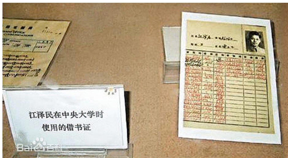
江泽民在汪精卫汉奸政府治下的南京大学的借书证