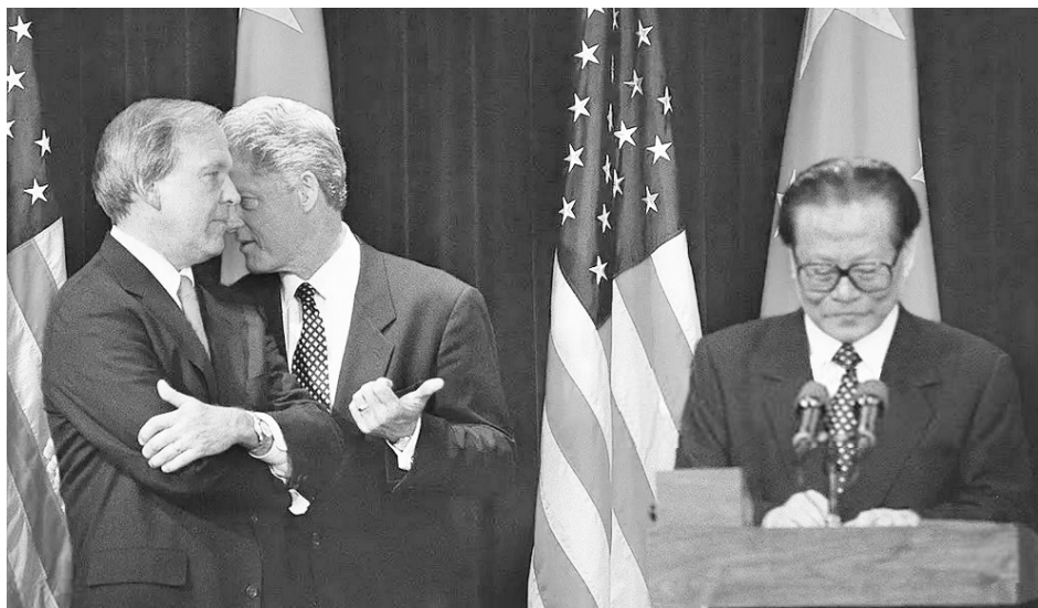
美国总统克林顿（中）与江泽民。1994年5月26日，克林顿宣布延长对华最惠国待遇，并决定将最惠国待遇与中国人权问题脱钩。