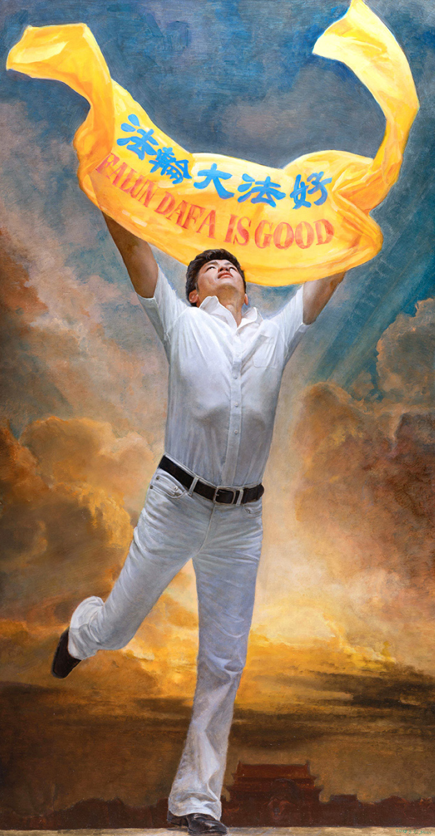
▲ 新唐人《全世界人物写实油画大赛》 油画作品《走上广场》作者 李园