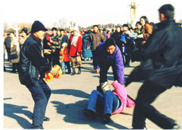
▲ 警察在天安门广场残暴地殴打法轮功学员。

绩”，想升官表现，就要对法轮功下“狠手”，并公开叫嚣：“杀人放火、偷东抢西我不管，炼法轮功就不行”。