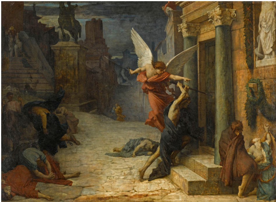
▲ 油画《被瘟疫侵袭的罗马城》中描绘了大天使指命疫鬼，除去那些迫害信徒的人。