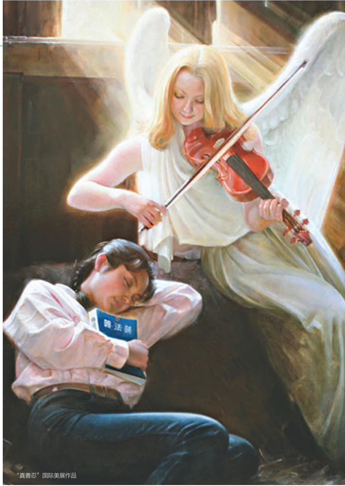
“真善忍”国际美展作品

也期望所有因教育子女而烦恼的家长都能有机会去了解法轮功，看看那本让上亿人身心变得健康的《转法轮》，把最美好的东西带给迷失了的孩子和自己。❶