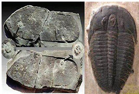
三叶虫鞋印化石（左）箭头处为三叶虫。右图为三叶虫化石放大图

三叶虫是细小的海洋无脊椎动物，与虾蟹同类。在地球上存在时间从6亿年前开始，至2.8亿年前灭绝。而人类的历史与之相比很短，能够穿上像样的鞋子不过才三千多年。这一切又该作何解释呢？我们人类所发现的化石，完全颠覆了我们既有的认知啊。