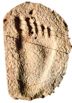
光脚小孩脚印化石