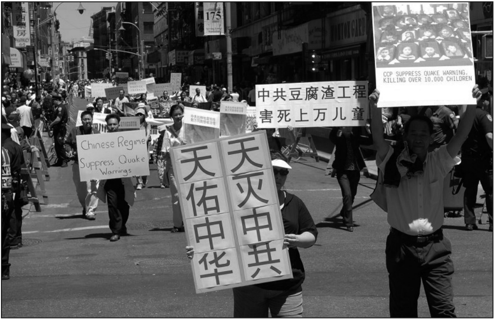
法輪功學員打出的「天滅中共，天祐中華」

經過無數次整人運動的中國人心底裡都知道，中共沒有任何道德的約束，下劣兇殘、說起謊來是沒有底線的。