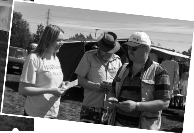
下圖：把修煉大法的喜悅與人們分享。