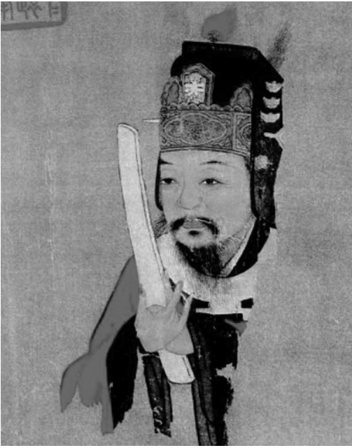
心憂天下的范仲淹

當今時代，物慾橫流，社會風氣一落千丈。宇宙「真、善、忍」大法降臨人間，給人們帶來美好和希望。在復興偉大神傳文化的今天，神韻藝術團以純真、至善、至美的演出向人們展現了中國神傳文化之美，通過藝術的表現傳遞真理和普及真理，使人領悟到人生、生命、宇宙之諸多