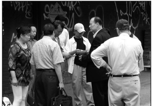
中共給雇來的打手們發賞錢

這筆錢是哪來的？來自中國政府對海外使領館的正常撥款中嗎？如果是這樣的話，證明中共確實在投入專項資金迫害海外法輪功學員；如果不是的話，中領館從美國各界募集的捐款的去向就非常值得質疑。為什麼在中領館收到這幾百萬的巨額捐款後，就立刻開始瘋狂收買僱傭親共華人，像發工資似的用大巴士一車一車運往紐約法拉盛？並且人人發錢。建議所有通過紐約中領館捐款的民眾，向其提出問責，並