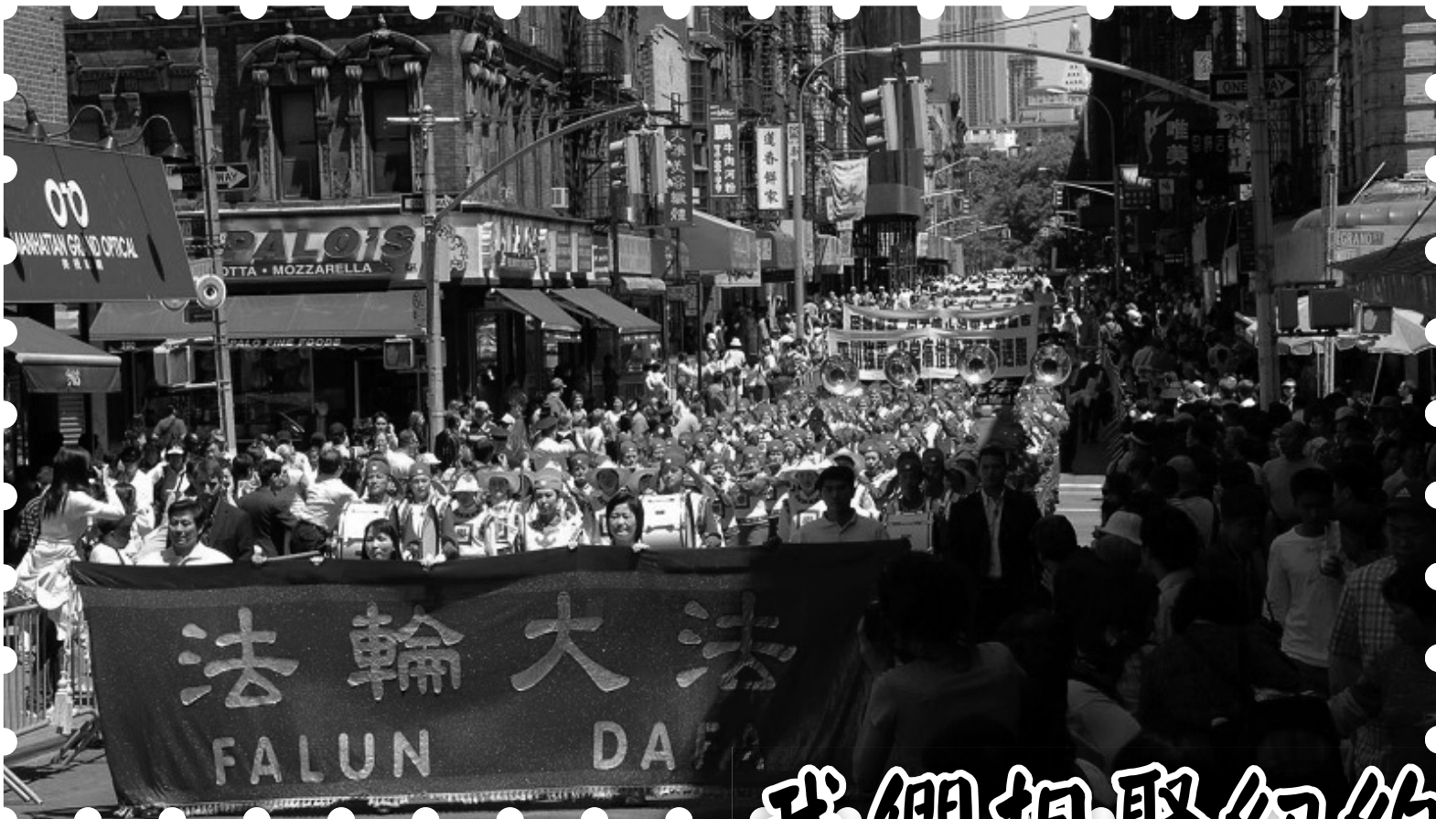
圖：2008年5月25日中午，兩千餘名法輪功學員在曼哈頓華埠舉行了大遊行

他告訴記者，他周圍的朋友都有給地震災區捐款，但他們都是通過紅十字會捐款，覺得這樣比較穩妥，可以直接送到百姓的手中，而交給中國大陸的一些機構總是不放心。