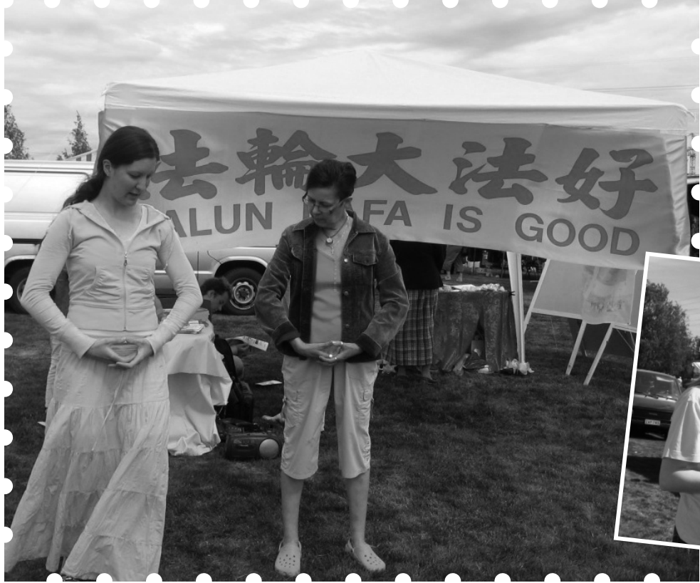
左圖：教者盡心學者認真。