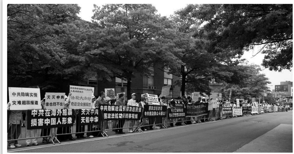
圖：法拉盛千人集會，譴責中共輸出迫害