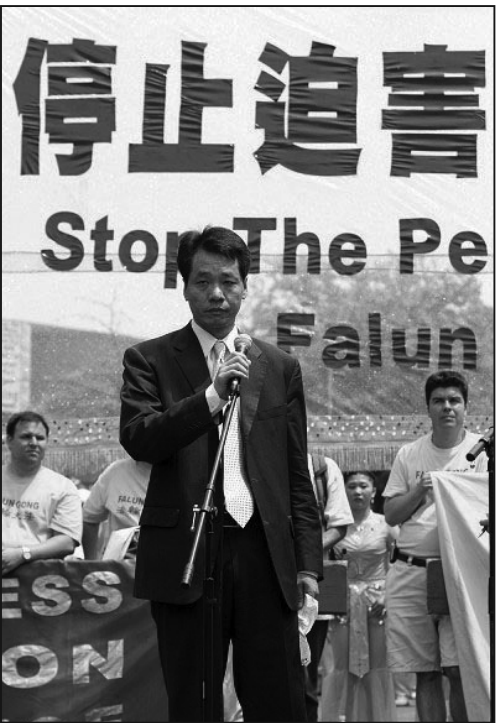
中國和平民主聯盟主席唐柏橋

中國和平民主聯盟主席唐柏橋先生以「中共多行不義必自斃」為題發言：中共治下社會的腐敗、不公已經達到了極點。回顧歷史，每個在場的人都是中共的受害者。今天我們在這裡支持的退黨大潮，是最好的，最和平、代價最小的、結束中共的途