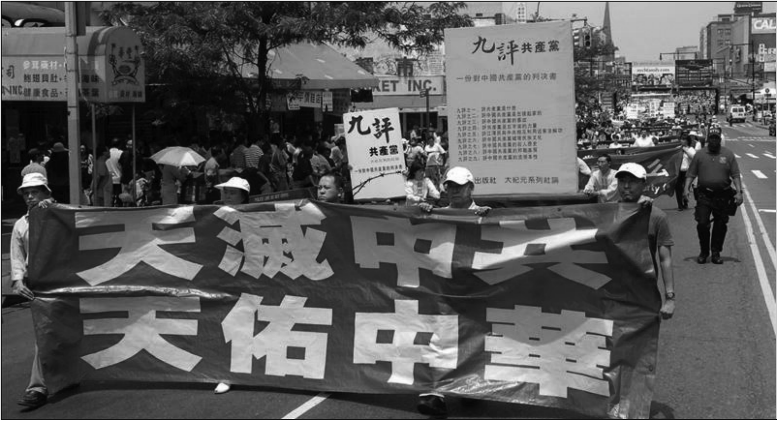
法輪功學員在各種活動中打出的口號是「天滅中共，天祐中華」，卻被中共篡改成「天滅中國」。

這張傳單的大致內容是：法輪功破壞四川地震賑災捐款活動，提出「天滅中國」的口號；中國在中共過去五十多年的領導下，社會安寧，國富民強，人們安居樂業；海外華人因為中共領導下的中國越來越強大，在全世界有了尊嚴；號召全美二千多個