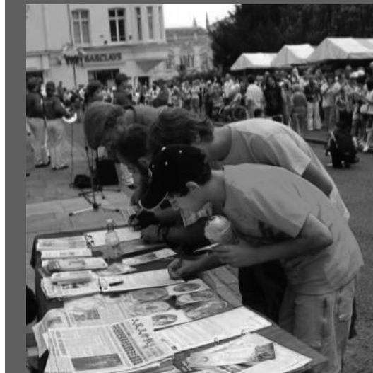
七月二十七日星期日，世界著名的大學城劍橋到處灑滿

確」的共產黨的對立面。 父母從此失去了人身自由，我的心裏也從此壓上了一塊巨石，搖搖欲墜。9年的日日夜夜，甚至一分一秒，常常因為他們的杳無音信，生死不明而變得無比的漫長。大洋彼岸傳來的消息一次比一次沉重。開除公職，經濟封鎖，數度的拘留，流落在外，杳無音訊，生死不知，終於是三年牢獄，酷刑加身。 2004年父母出獄以後，當地政府不允許他們辦任何證件，不許探視兒女。一頁一頁，不忍回想。 然而剛剛獲得片刻的平靜，又因為即將舉辦的「奧運」而再次天翻地覆。2008年7月16日晚上10點鐘，在大地就要沉睡的靜謐時刻，20多個警察突然破門而入，抄家搶掠，強行綁架了我67歲的父親母親，以維護「奧運」的和諧之名把他們投入看守所，到今天為止我都無法知道父親的近況。 為什麼一對修煉真善忍的老人要無端的承受這些苦難？追求美好信仰對於當權者是怎樣不能忍受的威脅、非要把他們關進黑牢？