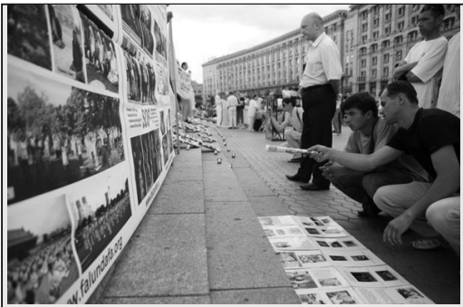
烏克蘭人認真了解法輪功真相

烏克蘭首都基輔法輪功學員七月二十日在市中心舉辦反酷刑展等活動，揭露中共九年來對法輪功學員所實施的群體滅絕政策，同時還進行了功法演示和燭光守夜活動。市民們在觀看真人模擬的酷刑展和瞭解真相後，紛紛簽名表示支持法輪功學員反迫害，同時譴責中共暴行。