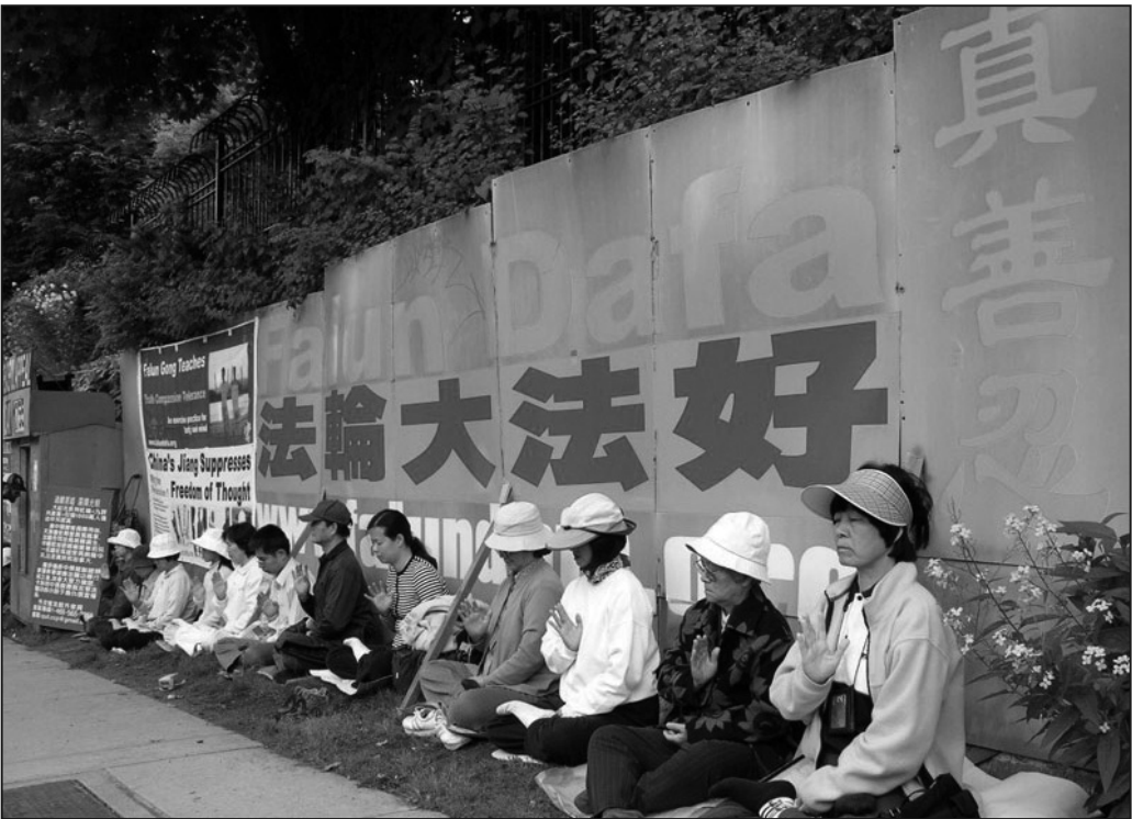
溫哥華學員為呼籲停止迫害不分嚴寒酷暑二十四小時在中領館前和平抗議已連續堅持兩千多個日日夜夜

中共無論怎樣迫害法輪功，因為它是用錢在做，用錢收買人參與迫害，用人民的血汗錢搞網絡封鎖，但它用錢買不來民心，所以必定不會長久。但法輪功學員是用心在做，用心講清真相呼喚良知。也有人對法輪功學員的付出不理解，但是，請相信他們的真誠。法輪功學員所做的都是出於善良，是在危難來臨前給人