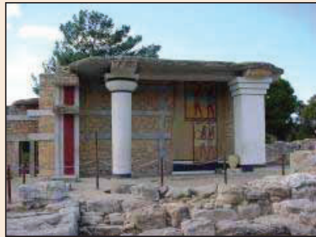
海上霸國消失之謎（第八版）