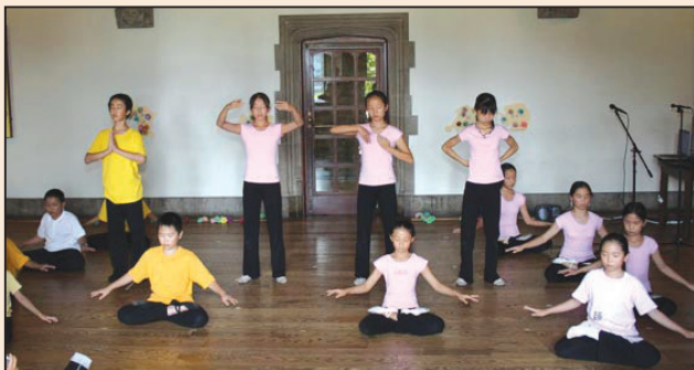
明慧學校夏令營 孩子收穫大（第四版）