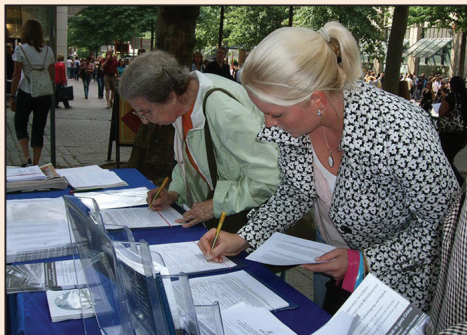
殘酷迫害驚醒德國漢堡人（第六版）