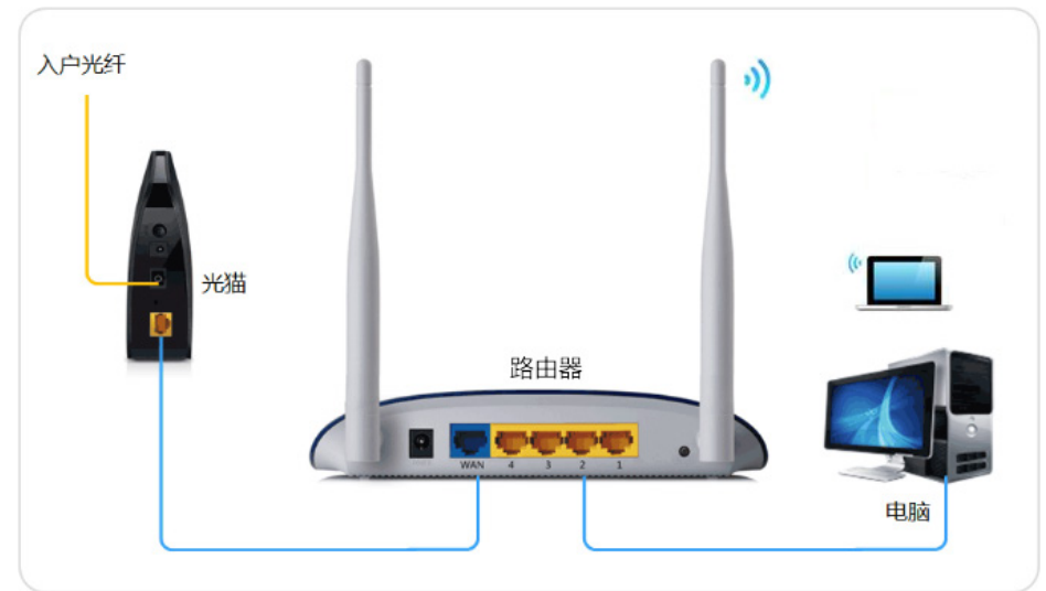
图：路由器是安装宽带网络时常用的一种设备