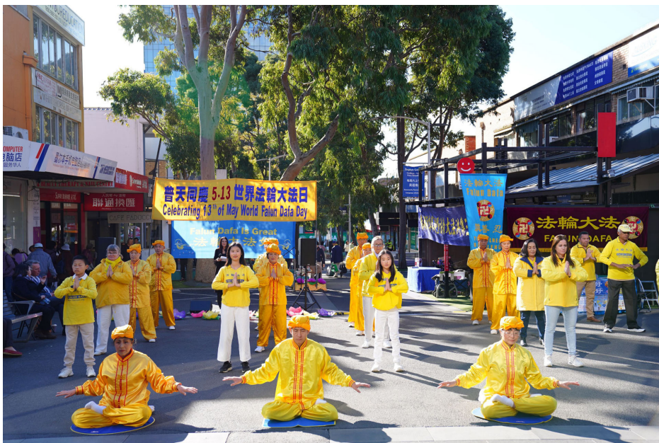
图：澳洲墨尔本部份法轮功学员五月三十一日在华人区博士山（Box Hill）的购物中心广场集会，庆祝第二十六届“5.13 世界法轮大法日”，多位政要亲临现场恭贺，赞誉法轮大法团体弘扬真、善、忍普世价值，为社区注入积极的精神力量，是澳洲社会的楷模。