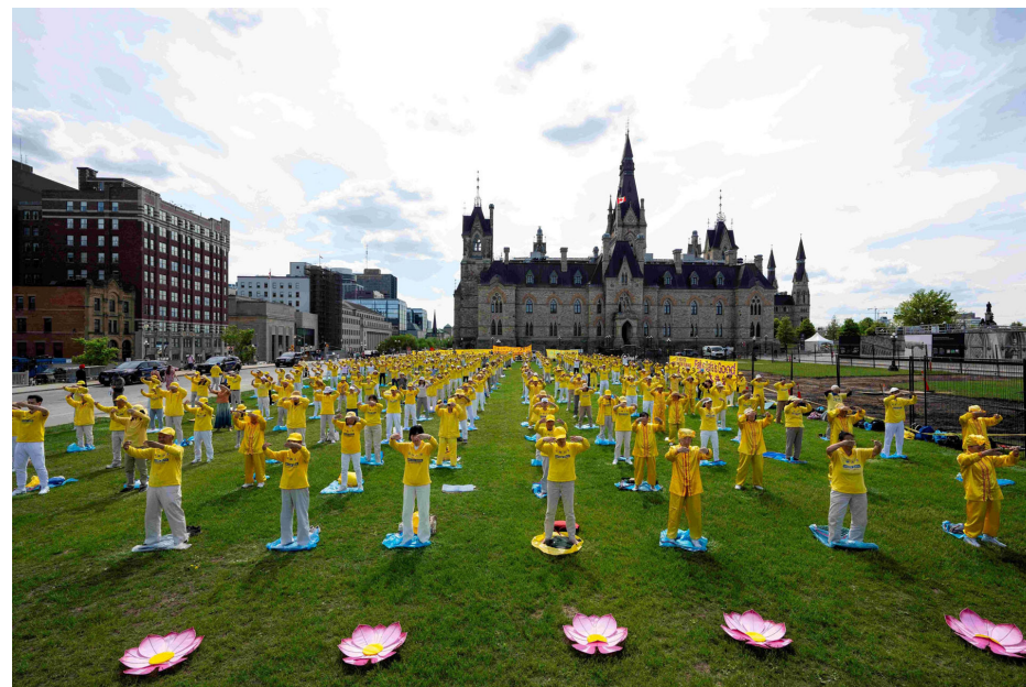
图：加拿大东部份法轮功学员五月二十八日在首都渥太华国会山庆祝法轮大法洪传三十三周年，十五位议员也来到国会山前同庆。