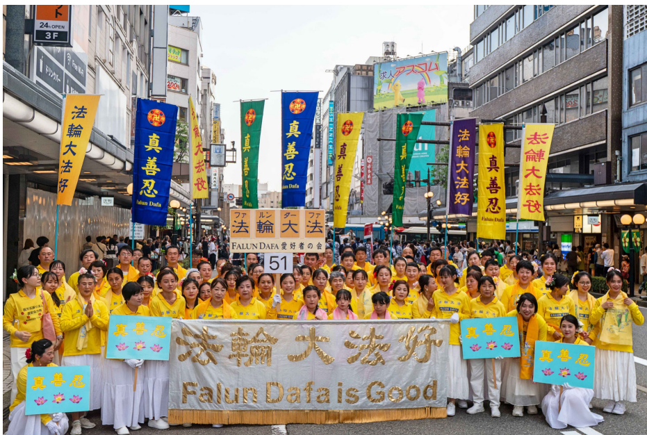
图：日本法轮功学员六月七日参加石川县金泽市举办的“金泽百万石庆典”（Kanazawa Hyakumangoku Festival），整齐划一、优美的舞蹈动作以及传达的真、善、忍理念，深受观众好评。