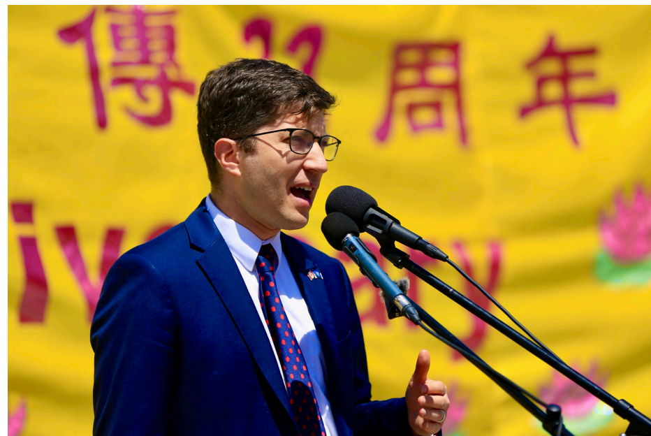
图：加拿大国会法轮功之友联合主席、国会议员吉尼斯（Garnett Genuis）对《法轮功保护法案》表示支持，他说，“我希望每个民主国家都能够通过立法，杜绝任何成为（活摘器官）同谋的可能。”“我们所有的领导人都必须呼吁停止对法轮功的迫害。”