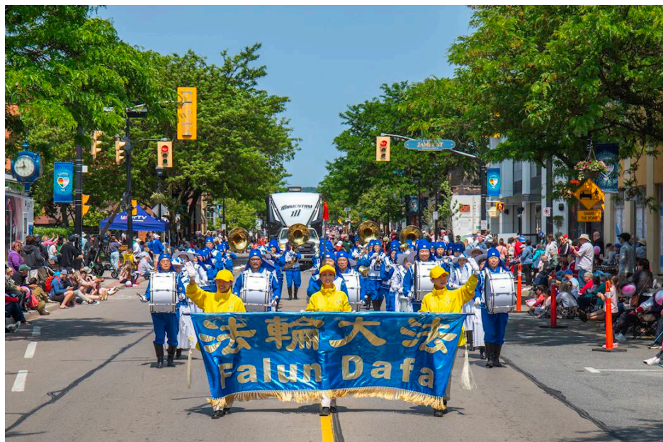
图：加拿大多伦多法轮功学员组成的天国乐团和腰鼓队六月十四日参与伯灵顿 (Burlington) 音乐节游行，受民众欢迎。