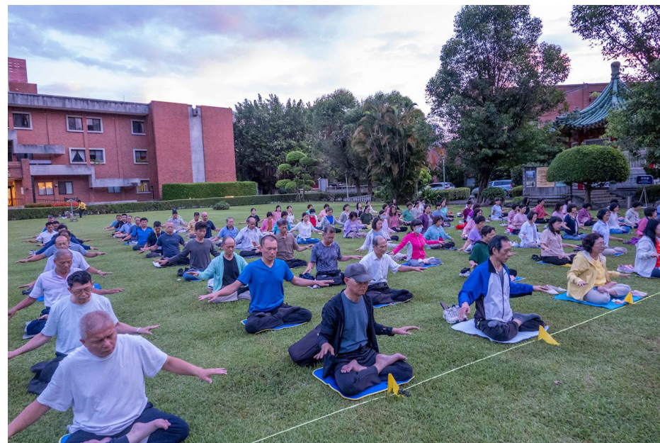
图：二零二五年六月二十九日清晨，台湾部份辅导员在台北剑潭青年活动中心前草坪集体炼功。