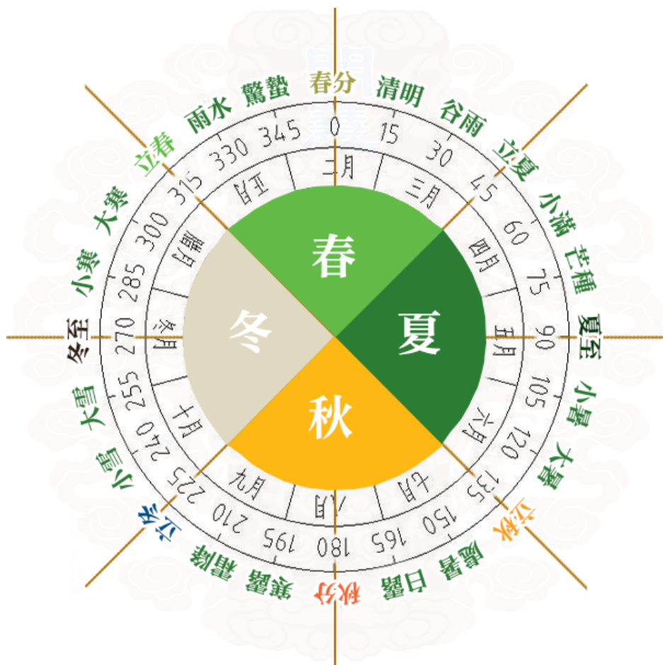
图片 2：二十四节气与黄道面的角度关系。

节气起源于黄河流域，早在春秋战国时期就已初具雏形，至西汉《太初历》时正式确立。《太初历》这部历法是在汉武帝太初元年（即公元前104年）完成的。古人对大自然的重视、了解与生存能力，由此可略见一斑。