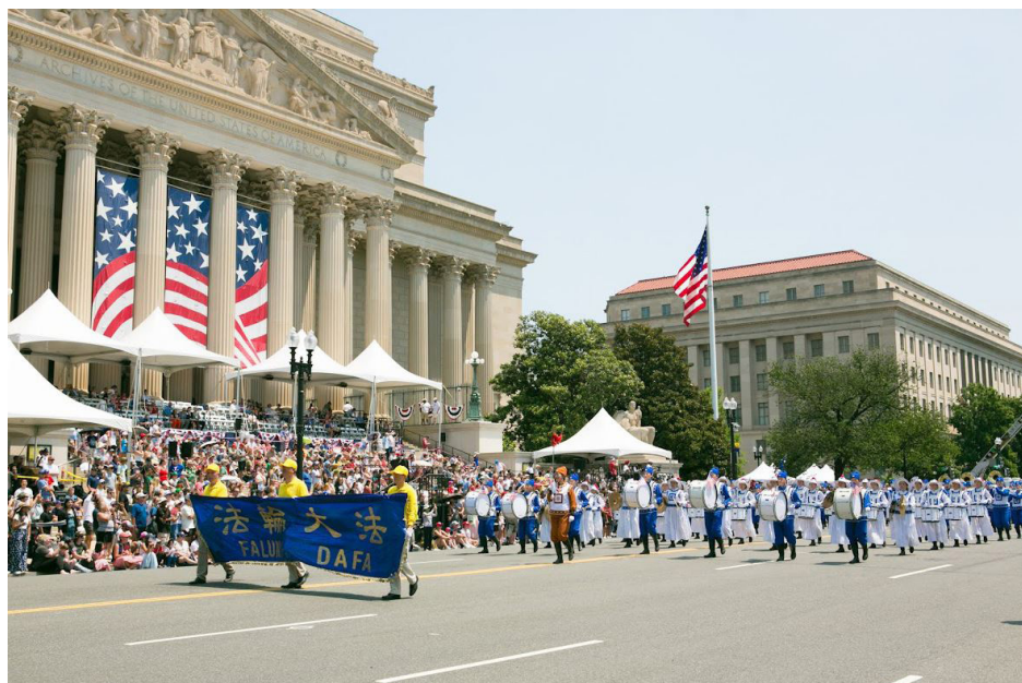
图：美国法轮功学员再次应邀参加七月四日在首都华盛顿DC举行的独立日游行，受到沿途民众的欢迎。