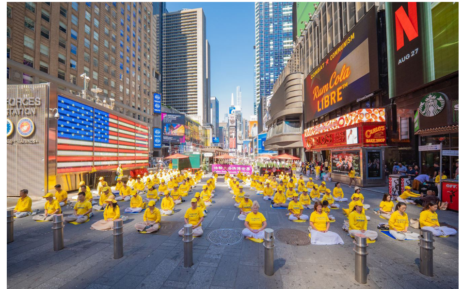
图：美国纽约和新泽西的部份法轮功学员八月二十三日下午在时代广场集体炼功。