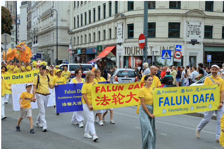
图：奥地利法轮功学员八月三十日在首都维也纳市中心举行游行，从赫尔穆特·齐尔克广场（Helmut-Zilk-Platz）出发，途经国家歌剧院、议会大厦、弗赖翁广场（Freyung）等著名景点。