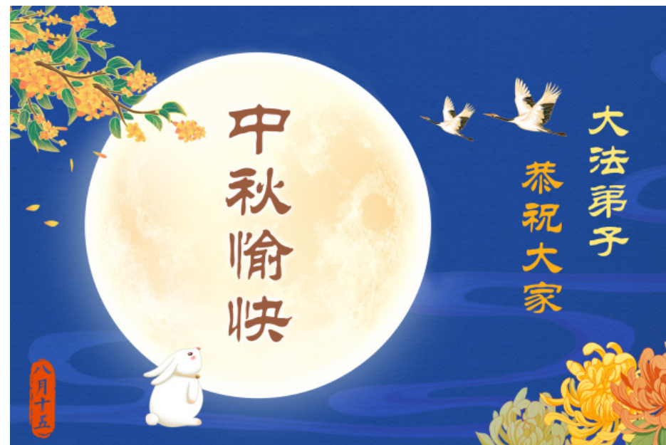
图：大法弟子恭祝大家中秋愉快！