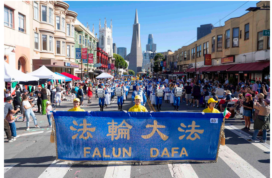
图：法轮大法美西天国乐团十月十二日参加旧金山一年一度的意大利传统日游行。主持人说：“他们一直是旧金山意大利传统文化游行的亮点之一。天国乐团已经参与游行超过十五年了。感谢你们的支持。”