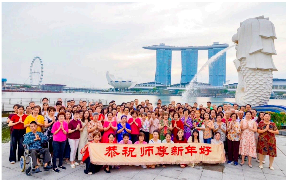
图：二零二六丙午中国新年即将到来，新加坡部份法轮功学员一月十八日在鱼尾狮公园，向慈悲伟大的师父提前拜年，表达内心的无限感恩。