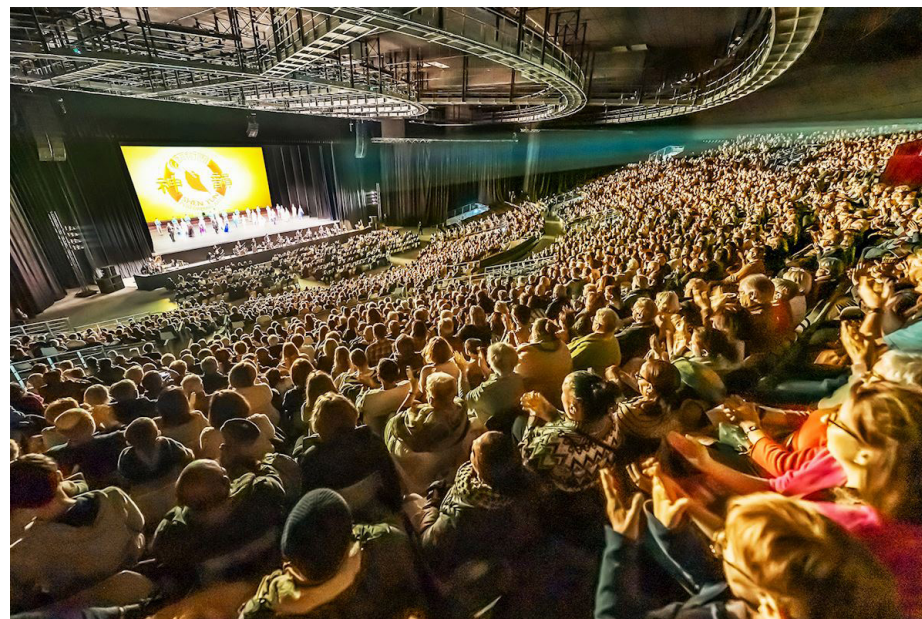
图：神韵八个艺术团同时在欧美五个国家演出。神韵国际艺术团在法国鲁昂泽尼特剧场（Zenith de Rouen）的五场演出场场爆满。