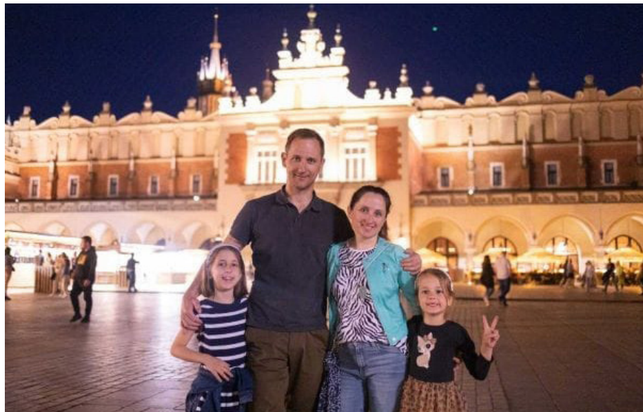
图：亚历山大和妻子以及两个女儿。

A同修让我上她家住，每天二十四小时的相处，她看到了我没实修、有许多做的不在法上的地方，她直接指出了我的不足，语气严厉而又无可反驳。我第一次被同修这么说，硬是憋着没让眼泪掉下来，我承受不住了，又想退缩，想这次回家做资料就不来了。但是每次我有这样想法的时候，A同修就象能看出来似的，在我走之前她就说：“今晚回来吧，你在这，早上我能起来炼功。”这样我又回到她家。可看到我的不足，她仍然直接指出，甚至在其他同修面前说我，那时我的脸是火辣辣的，心里很不舒服，但我知道A同修是为我好。因为我不能严格要求自己，她的严厉使我渐渐放