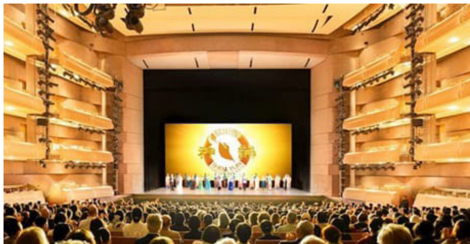
图：二零二六年六月二十五日晚，神韵纽约艺术团重返多伦多。图爲四季表演艺术中心。

为此先要说一下礼的来源。礼来源于神的启示与人的本性，是两方面的结合。在神启示给人类的时候，不但规范了人应当如何祭祀鬼神（鬼指祖先去世之后的生命状态，神指更高境界的神祇神明），而且还规定了人与人之间各种类型的关系。