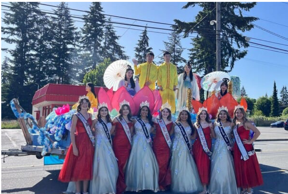
图：参加本届草莓节盛大游行的游行形像大使们，在法轮大法花车前合影留念。

·活动主持人也特别在解说词中提到：法轮功按照“真、善、忍”指导人提升心性，中国学员在中共二十七年的迫害下依然坚守信仰，巨大勇气令人敬佩。