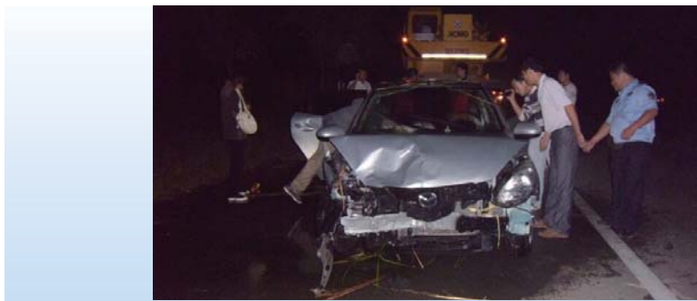
图：车祸现场 车被吊上岸后

四个人上岸后，报了警，交警和事故吊车赶到后，将车从河里吊出来，这时发现车子在撞击中已经严重变形，当场报废。