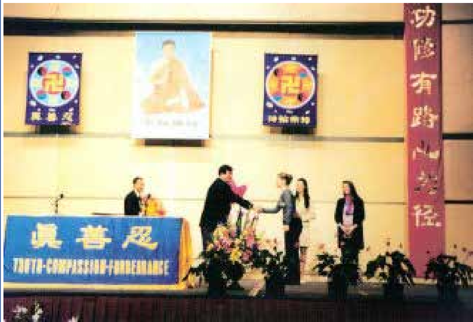
图 1 ~ 2: 1999 年 5 月，法轮功创始人李洪志先生莅临在悉尼举办的“全澳洲法轮大法修炼心得交流会”并讲法。

【明慧网二零二零年五月十九日】（明慧澳洲记者站采访报道）一九九九年五月二日至三日，“全澳洲法轮大法修炼心得交流会”在悉尼达令港国际会展中心大厦召开。当时有来自澳洲、美国、加拿大、瑞典、泰国、日本、新西兰、新加坡、香港、澳门、印度尼西亚和中国大陆等地的二千七百多人到场，有幸聆听了师尊李洪志大师的讲法和答疑。