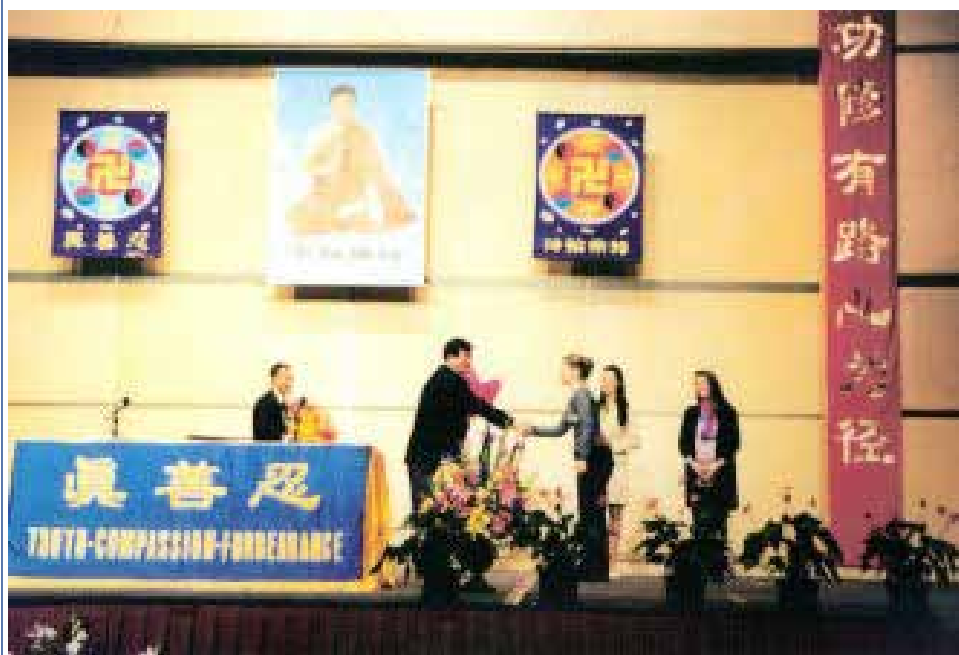
图 1 ~ 2: 1999 年 5 月，法轮功创始人李洪志先生莅临在悉尼举办的“全澳洲法轮大法修炼心得交流会”并讲法。

【明慧网二零二零年五月十九日】（明慧澳洲记者站采访报道）一九九九年五月二日至三日，“全澳洲法轮大法修炼心得交流会”在悉尼达令港国际会展中心大厦召开。当时有来自澳洲、美国、加拿大、瑞典、泰国、日本、新西兰、新加坡、香港、澳门、印度尼西亚和中国大陆等地的二千七百多人到场，有幸聆听了师尊李洪志大师的讲法和答疑。