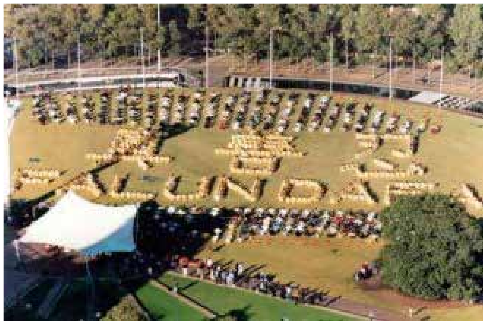
图3：1999年5月，“全澳洲法轮大法修炼心得交流会”期间学员们排字。

二十一年过去了，岁月抹不去这永恒的记忆。回想起师尊讲法时的谆谆教诲，以及大法弟子们整个身心感受到的前所未有的轻松和愉悦、那种生命得救后的欢乐，仿佛就在昨天。