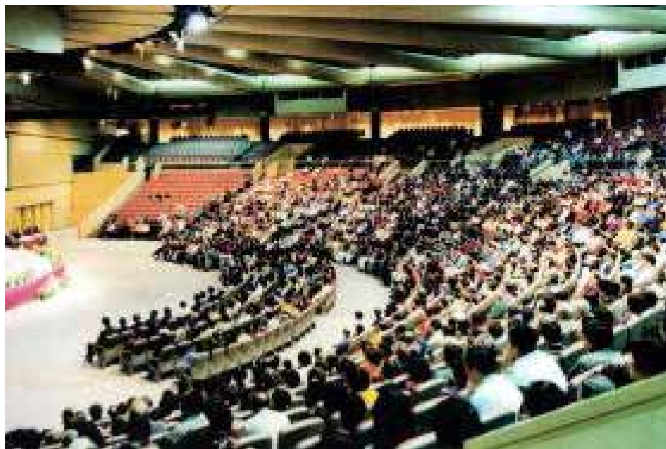
图4～5：1999年5月，“全澳洲法轮大法修炼心得交流会”中2000余名大法弟子聆听师父讲法。