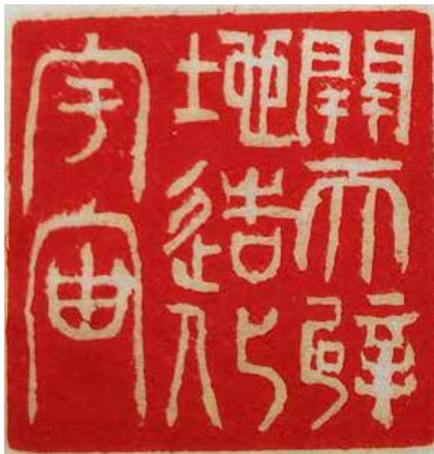
开天辟地造化宇宙