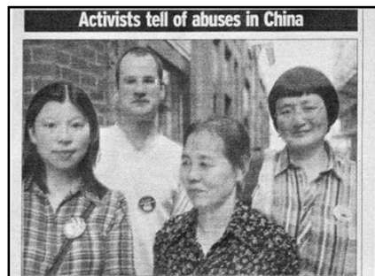
▲英国谢菲尔德今日报图片