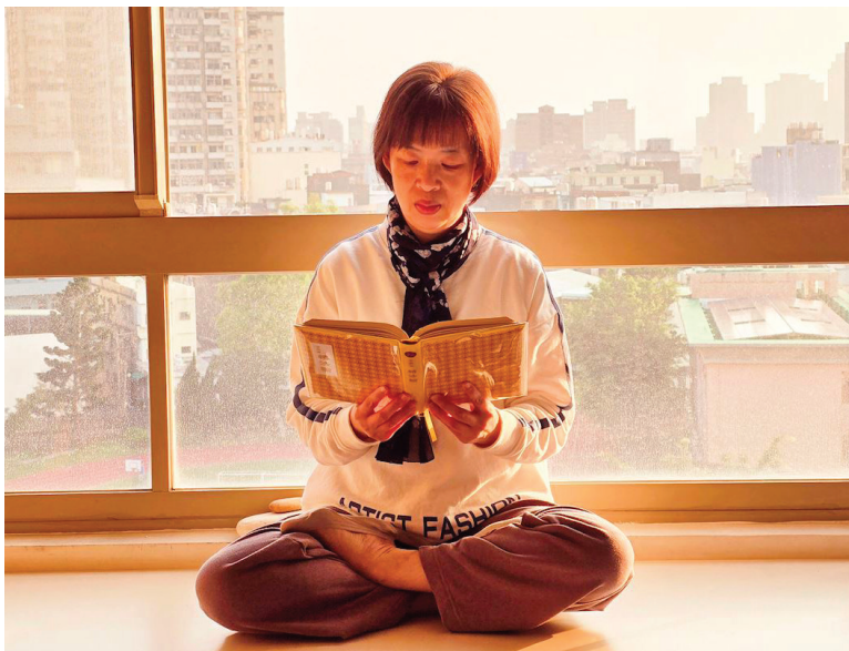
■ 淑云表示《转法轮》是她获得平静、喜悦和生命力量的源泉。

她说：“但是，在事务所的这两年，却给我的思想带来了很大的冲击。我发现来找律师争讼的人，有的是兄弟争产，有的是夫妻反目，有的为了金钱土地。那一场又一场你