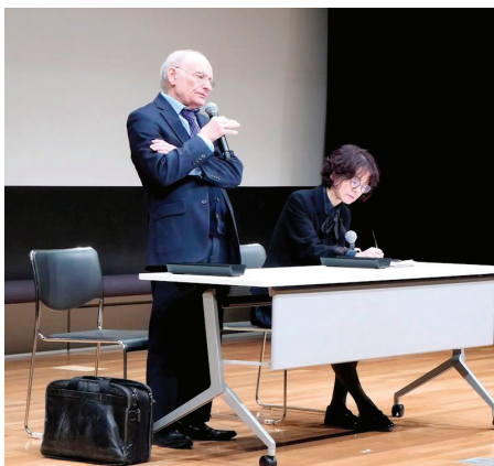
■ 麦塔斯先生现场回答观众问题。

何才能制止对法轮功学员的器官活摘？”对此，麦塔斯先生回应道：“医疗技术本应是为提高人们健康和生活水平而发展的，但在中国却被滥用，成为大规模侵犯人权和大量屠杀的工具。针对这个问题，医疗行业和各界人士已经开始采取行动。