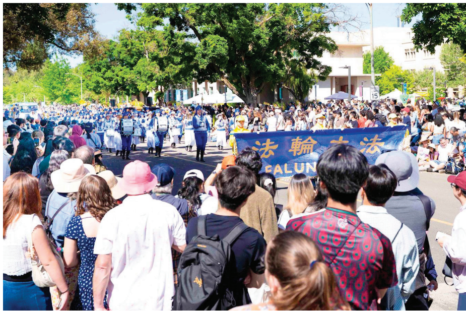
美国加州大学戴维斯分校举行“野餐节”游行，法轮功团体受欢迎。

过真相传单说，“让我抓紧这个传单，把她放在靠近我心的地方，我一直在寻找这样的原理，真、善、忍可以指导我每天的生活，每个人都应该遵循。”