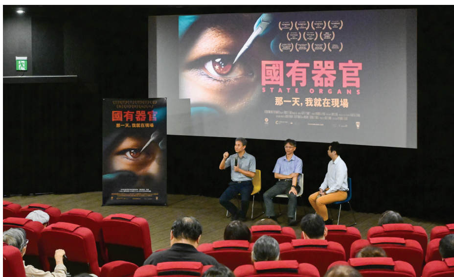
■ 荣获多个国际奖项的大型纪录片《国有器官》。资料照。

矿是消耗品，是不可再生的，把人当矿，自然就不会想让他再生。我们也很容易想到“人矿”的命运：有用则尽用，无用则弃之。当然，这里说的不是人才，不是人尽其才。