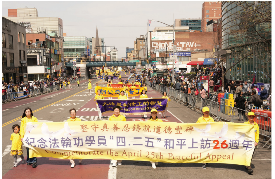
■ 4月19日，数千纽约法轮功学员在法拉盛举行了盛大的游行活动。

功学员均举行活动，纪念这个载入历史丰碑的日子。近年来，越来越多的明白真相的海外华人也参与了纪念活动。