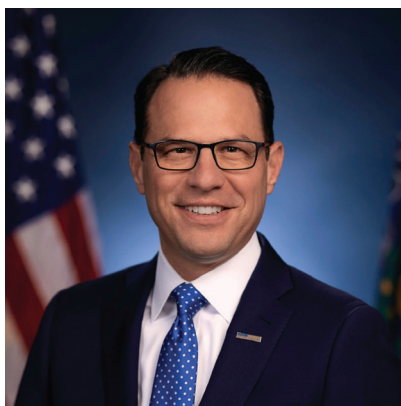
■ 宾州州长乔什·夏皮罗为李洪志先生颁发特别证书。