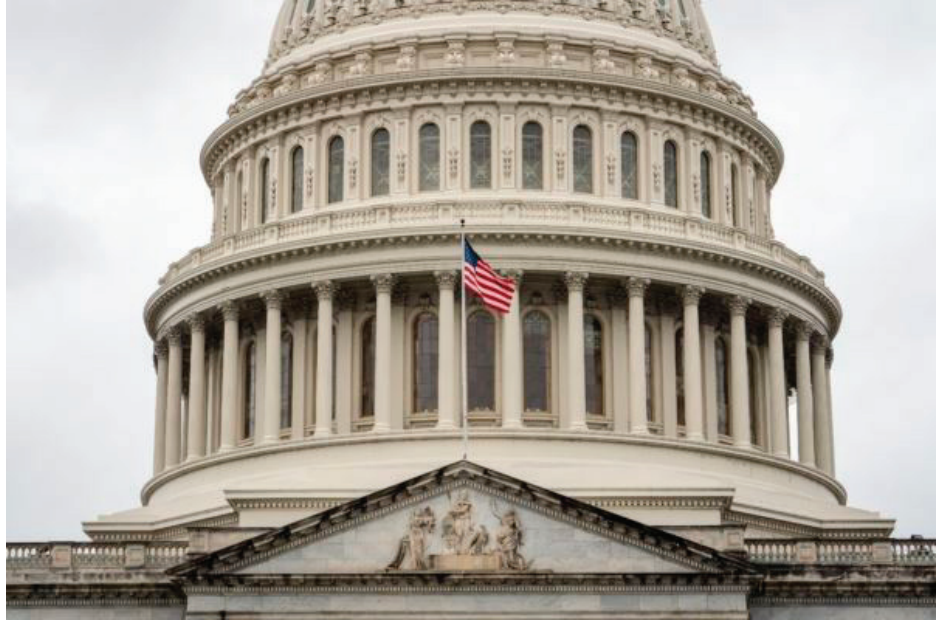
■ 2025年5月13日，美国国会大厦升美国国旗，向李洪志先生致敬。

【明慧网】2025年5月13日是第26届“世界法轮大法日”暨法轮大法洪传世界33周年纪念日。位于华盛顿DC的美国国会大厦两度升起美国国旗，特别表彰法轮大法创始人李洪志先生把以真、善、忍为核心原理的法轮大法洪传世界的杰出贡献，并庆祝世界法轮大法日。