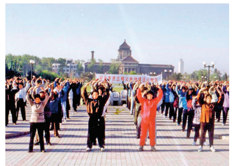
■ 1998 年长春法轮功学员集体炼功

1999 年 7 月 20 日，中共发动了对法轮功的全面迫害，引发全球法轮功学员反迫害、讲真相活动。事实证明，这场迫害不仅针对法轮功学员的“真善忍”信仰，也在试图泯