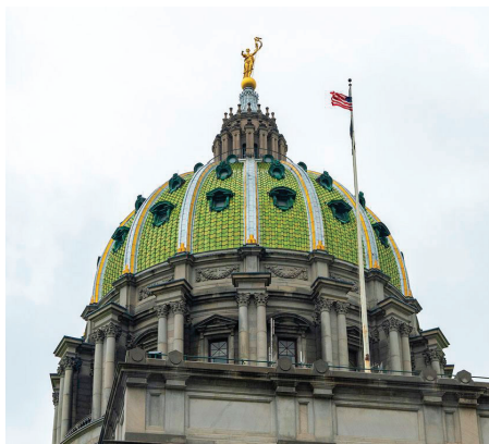
■ 宾州州府议会大厦升起国旗。