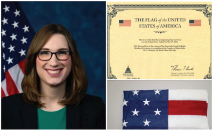
■ 联邦众议员萨拉·麦克布莱德