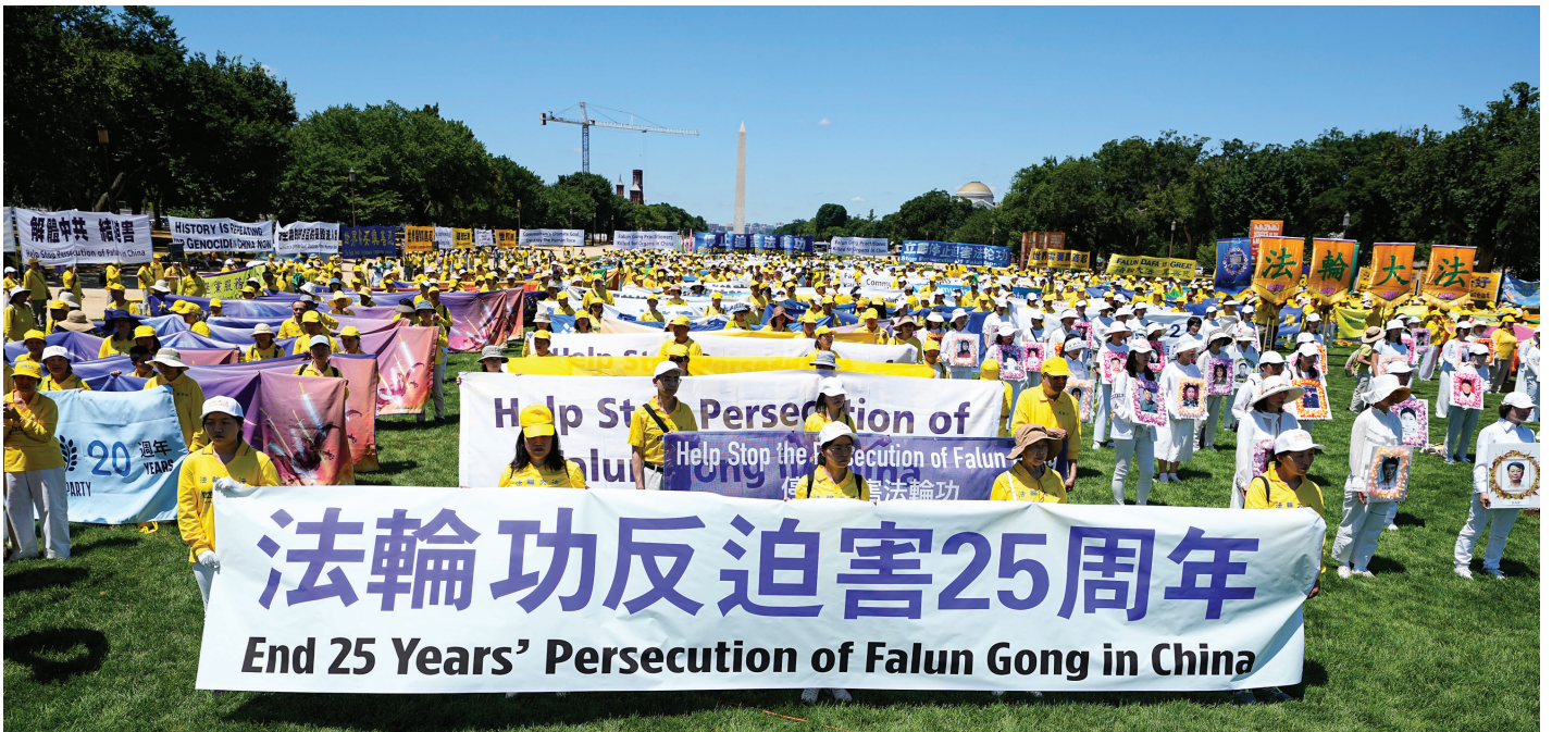
■ 2024 年 7 月 11 日，来自美国各地的部分法轮功学员和支持者在美国首都华盛顿国会山附近的国家广场 (National Mall) 举行大型集会，呼吁“解体中共、停止迫害法轮功”。