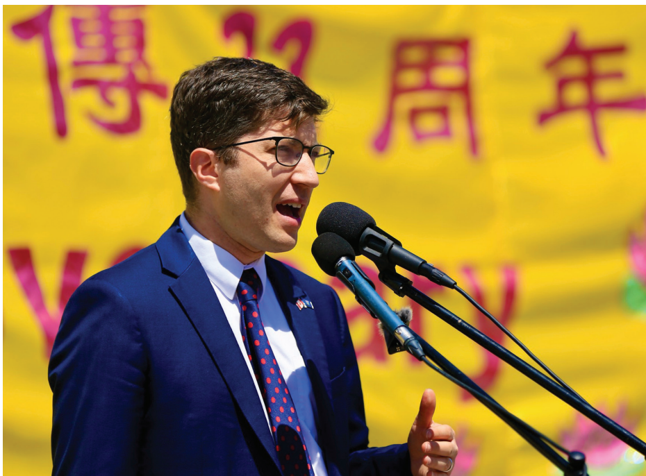
■ 吉尼斯在法轮大法洪传33周年庆典上演讲。

早在2022年12月14日，加拿大国会以324票全票通过《打击非法人体器官摘除和贩运法案S-223》，该法案被普遍认为是加拿大打击活摘器