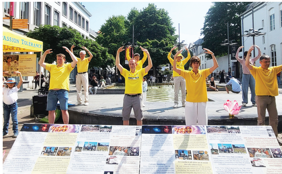
■ 6月14日，法轮功学员们在安特卫普市商业中心大街上集体炼功弘法。

她坦言，自己长期从事护理工作，对真、善、忍的理念感同身受。“善心和耐心一直是我作为护士的本份。我特别能体会到这些价值的重要