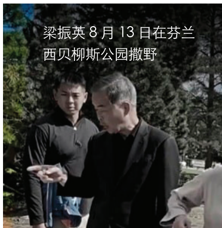
梁振英8月13日在芬兰西贝柳斯公园撒野

从现场视频披露的信息看，梁振英当场威胁法轮功学员；盘问个人信息，还有拍照留存。这些行为涉及到个人身份信息的收集和使用。在欧盟，这类数据是受到严格保护的；同为欧盟成员国的芬兰，适用《通用数据保护条例》（GDPR）；如胁迫非法收集，可由芬兰数据保护监察专员介入调查；个人亦可报警，因涉及骚扰、恐吓甚至侵犯隐私权。