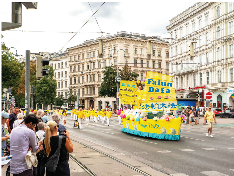
■ 8月30日，法轮功学员在奥地利首都维也纳市中心游行。