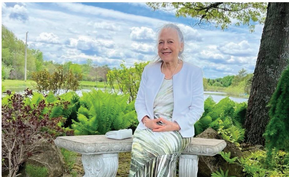
■ 妮可在加拿大魁北克市生活。

和悲伤。大法慈悲的教导让我感到无比温暖，我学会了平静地面对情绪，内心越来越安宁、喜悦。我没有刻意做任何改变，随着修炼自然而然发生了。”