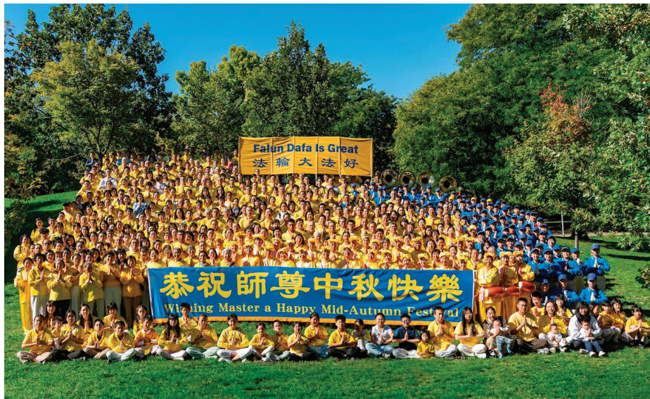
■ 多伦多法轮功学员在克里斯蒂公园，恭祝师父中秋快乐。