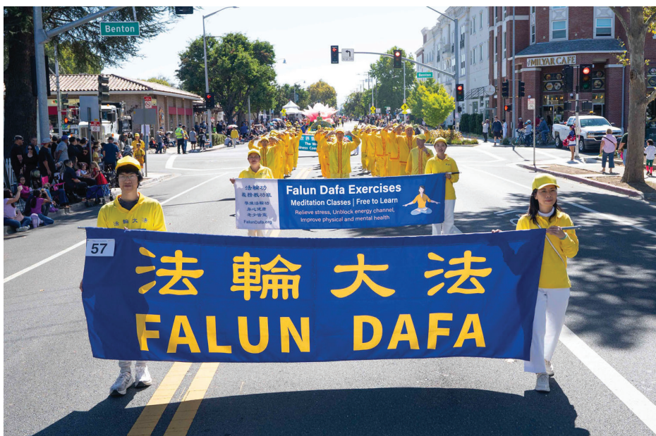
■ 10月4日,旧金山湾区的法轮功学员应邀参加圣塔克拉拉冠军游行。

炼。法轮功(法轮大法)是佛家修炼功法,包括动功和静功;在炼功队后面,是花车,花车上的莲花象征纯洁和力量;紧接在后的是法轮功腰鼓队。