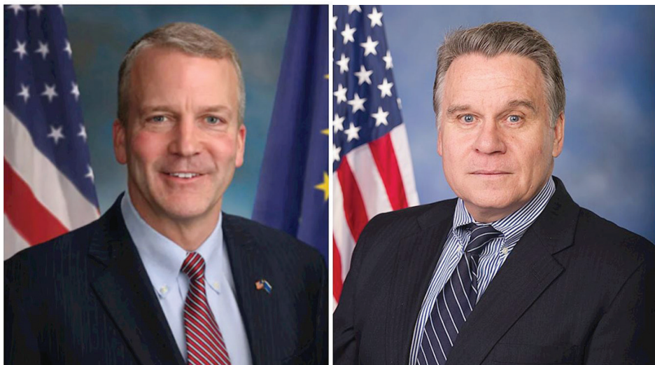
美国会及行政当局中国委员会主席沙利文（左）和共同主席史密斯（右）

【明慧网】2025年12月10日国际人权日，美国国会及行政当局中国委员会(CECC)发布2025年年度中国人权报告。委员会共同主席、众议员克里斯·史密斯表示，“中共领导下的中华人民共和国一再证明，它寻求霸权，目的是将它强加于本国公民的暴政强加于世界其它国家。”“中国不是国际社会负责任的一员，因为它由共产党统治。”