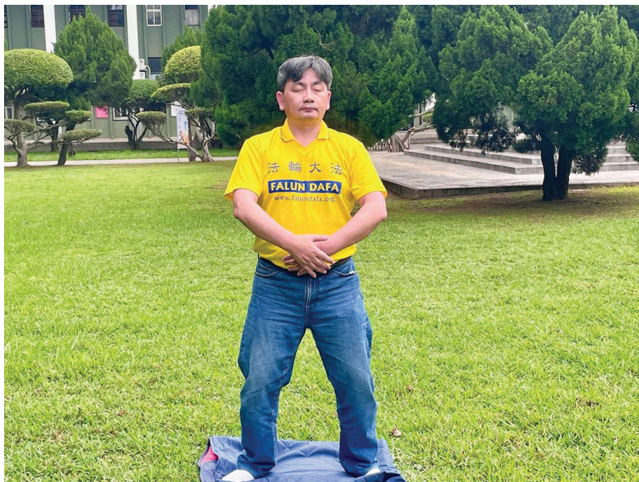
▲ 祥富在炼功后，身心发生很大的变化。