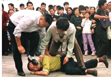
天安门广场便衣正在暴打法轮功学员

编注：“六一零”办公室为迫害法轮功的专门机构，凌驾于宪法和法律之上，相当于文革时期的“中央文革领导小组”和二战时纳粹希特勒的“盖世太保组织”。◇