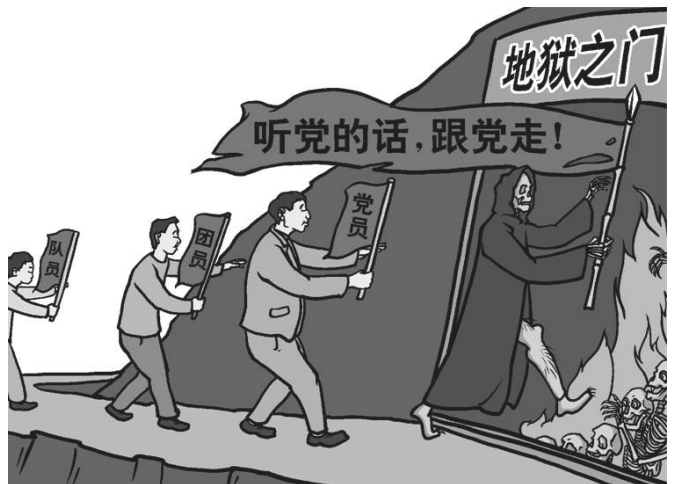
漫画：听党的话，跟党走，走入地狱门

行恶者固然有其可恨、可怜之处，而其幕后黑手是中共。大陆警察的出路只有摆脱中共附体，明辨是非，真正为自己的生命负责。◇