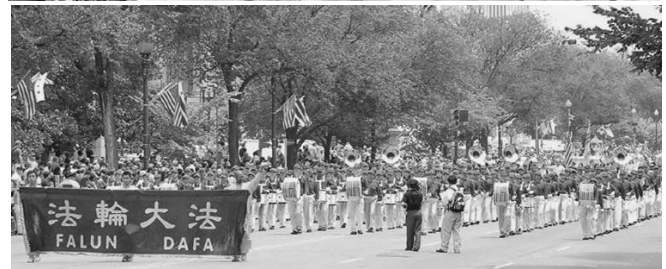
▲法轮功学员的精美花车和气势恢宏的“天国乐团”