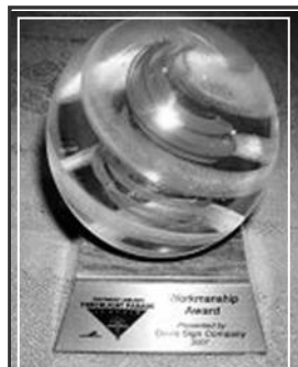
法轮功「大法船」花车荣获最佳「制造工艺」奖

【明慧网】第五十八届“海洋节炬光游行”于七月二十八日晚在西雅图市中心的大道上举行。在现场三十万观众的欢呼声中，在电视机前七十万观众的期待中，法轮功队伍以气势磅礴的二百人阵容，展现了从现代西方文明到东方神传文化、从人间至天国的美好景象。法轮功浩浩荡荡的“天国乐团”令人赞叹不已；恢宏精美的“大法船”更令人叹为观止。电视七台评论员向观众介绍时说，“这是从古老庄严的唐朝直接驶来的法轮功‘大法船’花车。她获得了今年的最佳‘制造工艺’，非常绚丽多彩，具有非常的想象力！”◇