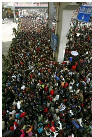
每天都有近 20 万人滞留的广州火车站