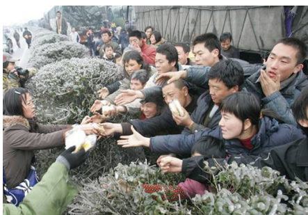
2.7 万辆车、8 万多名乘客和司机滞留在京珠高速公路湖南境内，有些乘客被困几天没吃东西。图为被困人群抢食品