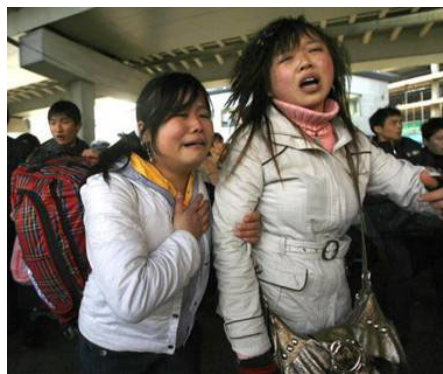
广州火车站，两年轻女性面对混乱的场面无助的哭泣。