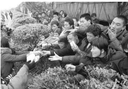
2.7 万辆车、8 万多名乘客和司机滞留在京珠高速公路湖南境内，有些乘客被困几天没吃东西。图为被困人群抢食品