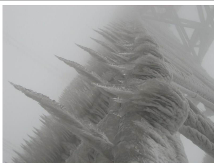
恐怖的电力铁塔厚冰