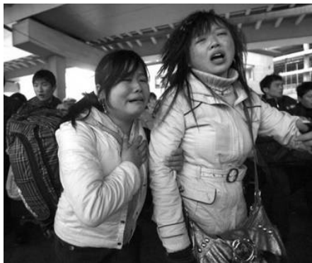
广州火车站，两年轻女性面对混乱的场面无助的哭泣。