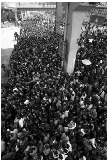
每天都有近 20 万人滞留的广州火车站