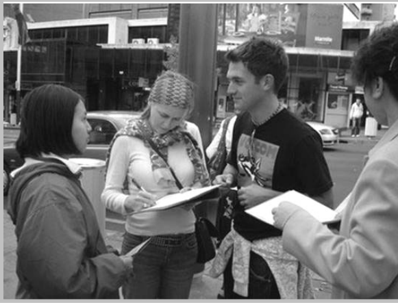
上图：新西兰民众关注法轮功真相，签名支持反迫害

新西兰最大城市奥克兰市中心AOTEA广场上，人们驻足观看揭露中共对法轮功长达九年残酷迫害的展板，询问详情，并签下自己的名字，表达对正义的支持，共同谴责中共暴行。