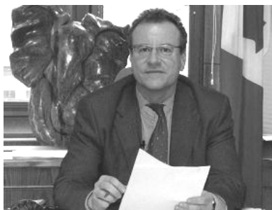
■加拿大国会议员瑞兹纽科斯基

加拿大“国会法轮功之友”副主席、国会议员博瑞·瑞兹纽科斯基（Borys Wrzesnewskyj）3月23日在接受记者采访时谈了对605决议案的看法，他说：“迫害法轮功是一个根本不应该发生的恐怖事件，现在是世人发出声音的时候了，这也是这项决议案所做的。它记录着迫害发生了十年，也在呼吁具体的行动。例如，在第二条里，呼吁废除所谓的‘六一零办公室’。”