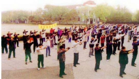
■ 迫害前，清华大学的法轮功学员在清华学堂前炼功。