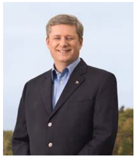
左图：法国巴黎学员庆祝法轮大法日；中图：加拿大多伦多学员庆祝法轮大法日；右图：加拿大总理哈珀