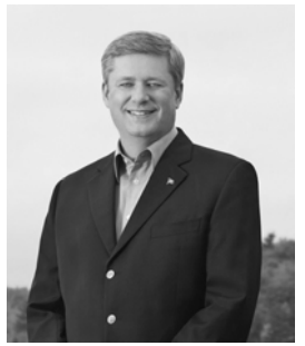
左图：法国巴黎学员庆祝法轮大法日；中图：加拿大多伦多学员庆祝法轮大法日；右图：加拿大总理哈珀