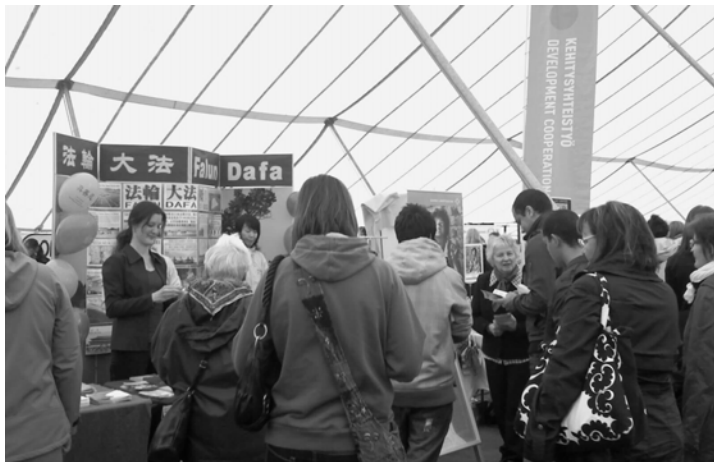
图：世界村活动中人们围在法轮功展台前了解真相

各国政要代表当地民众发出褒奖，传达的是民众的呼声，而这种呼声的基础自然是事实与公义。那就是，亿万人的修炼实践证明，法轮大法是大法大道，在把真正修炼的人带到高层次的同时，对稳定社会、提高人们的身体素质和道德水准，也起到了不可估量的正面作用。法轮大法的真、善、忍原则为人类铺就了一条返本归真的永恒之路，在连宵风雨中，法轮功已弘传世界一百多个国家和地区，这彰显着大法的威德，也预示着光明的未来。◇